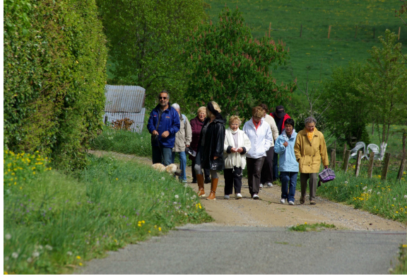
Balade 1 er Mai