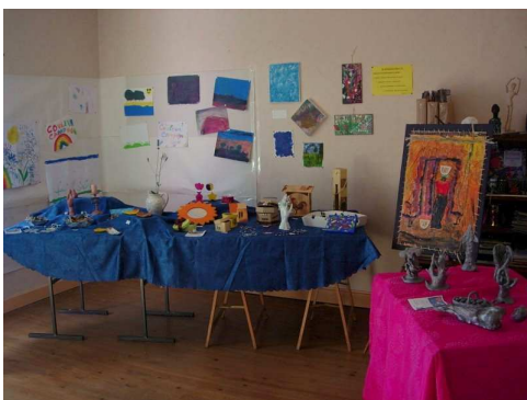
Expo vente 1 er août