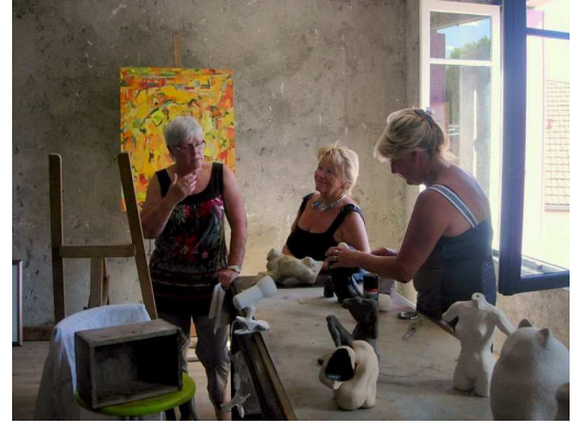
Echanges d'idées pour l'exposition 1 er Août

Nous avons commencé avec divers ateliers comme la peinture, le dessin, loisirs créatifs, modelage, la photo.